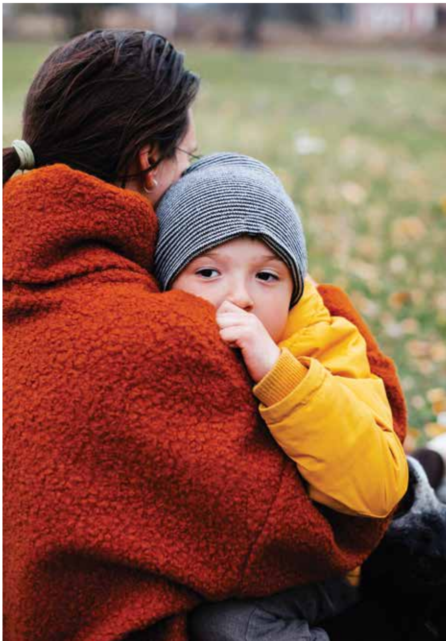
Die Eltern von Leonid möchten sein Gesicht schützen, darum zeigen wir ein Symbolfoto.