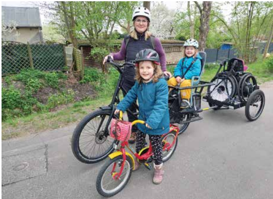
Ein neuer Alltag auf zwei Rädern: Das Lastenrad hat das Leben der kleinen Familie enorm verbessert.